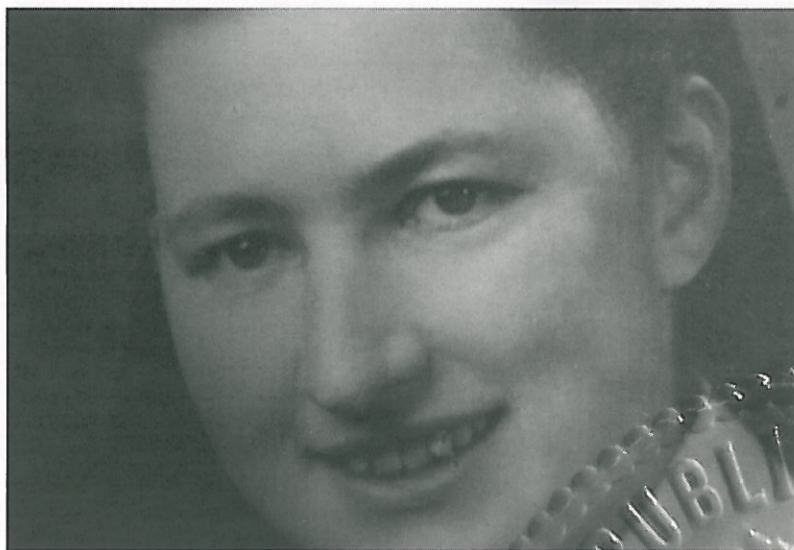
Abb. 2: Ein Bild aus früheren Tagen als wichtige Hilfe für den Zahntechniker, um die ursprüngliche Optik der Zähne zu rekonstruieren.